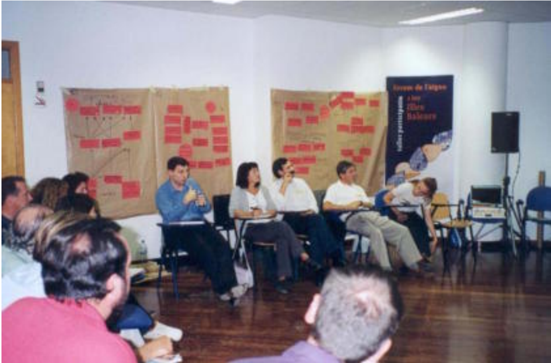
“Panorámica del grupo del taller del Foro en Pitiüses”

Taller de Pitiüsas. Can Ventosa, Eivissa.