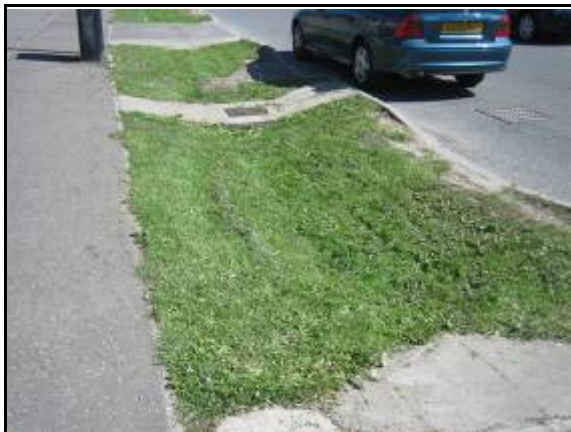
Figura 5. Cuneta verde. Dundee. Escocia.