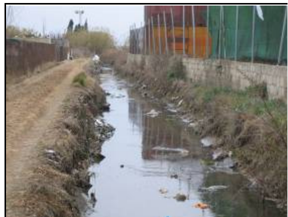
Figuras 1 y 2. Problemas de inundaciones y contaminación asociados al drenaje convencional.