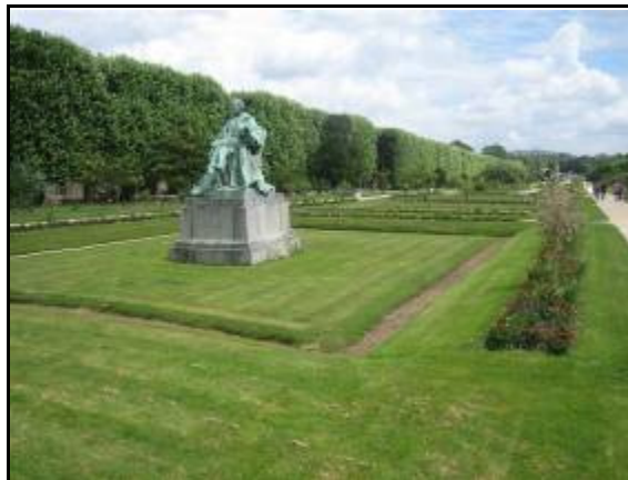
Figura 6. Depósito de Detención-Infiltración. París.

Contemplar el agua de lluvia como un recurso natural, permite realizar una gestión hídrica más eficiente, contando con el aprovechamiento de las aguas pluviales, bien para su reutilización o para su infiltración al subsuelo.