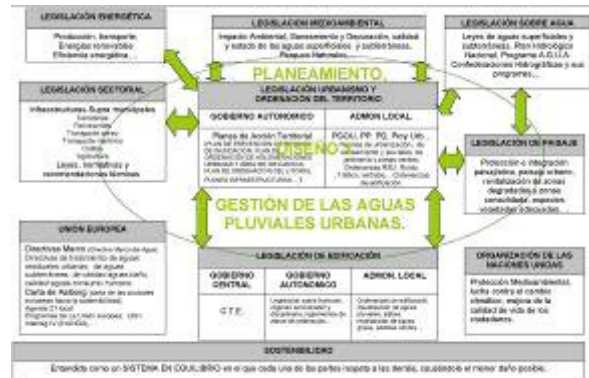
Figura 7. Implicaciones del Urbanismo y la Ordenación del Territorio en la Gestión de Aguas Pluviales Urbanas (Valls, G. y Perales, S., 2008).

Como se ha visto, ya está ampliamente reconocido a nivel mundial que se necesita un cambio en la manera de gestionar el agua de lluvia en entornos urbanos. Para que España pase a formar parte del grupo de países que están convencidos de que el camino a seguir es la implantación de la filosofía de los SUDS, se precisa un esfuerzo coordinado de todos los entes implicados (ciudadanía, administraciones, universidades, empresas, etc.).