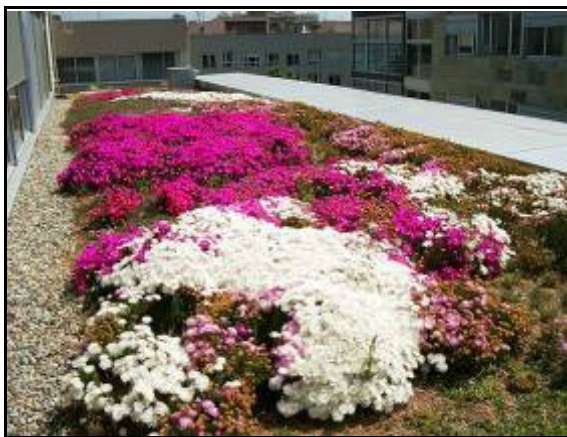
Figura 3. Cubierta Ecológica. Consell Comarcal. Barceleona.

Por su parte, se consideran medidas estructurales aquellas que gestionan la escorrentía contaminada mediante actuaciones que contengan, en mayor o menor grado, algún elemento constructivo, o supongan la adopción de criterios urbanísticos ad hoc . Las medidas estructurales más utilizadas son: Cubiertas Ecológicas ( Green Roofs ), Superficies Permeables ( Porous/Permeable Paving ), Franjas Filtrantes ( Filter Strips ), Pozos y Zanjas de Infiltración ( Soakaways & Infiltration Trenches ), Drenes Filtrantes ( Filter Drains ), Cunetas Verdes ( Swales ), Depósitos de Infiltración ( Infiltration Basins ), Depósitos de Detención ( Detention Basins ), Estanques de Retención ( Retention Ponds ) y Humedales ( Wetlands ).