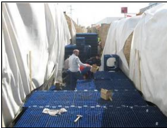
Figura 8. Depósito de Reutilización de pluviales formado por elementos reticulares. Zaragoza.

La construcción se realiza utilizando nuevos materiales que se adaptan a las necesidades particulares del proyecto: se emplean estructuras modulares reticulares de polipropileno (reciclables) que envueltas con una lámina impermeable conforman el depósito de reutilización, y ruedas de neumáticos usados (reciclados) que envueltas en geotextil crean el espacio necesario para la retención temporal del agua y permiten la infiltración del agua en el terreno. De este modo, se rellena la zanja excavada hasta la cota del pavimento adyacente, y sobre un geocompuesto de refuerzo se vierte una capa de gravas como acabado superficial, que además permite el paso del agua a su través y no genera escorrentía.