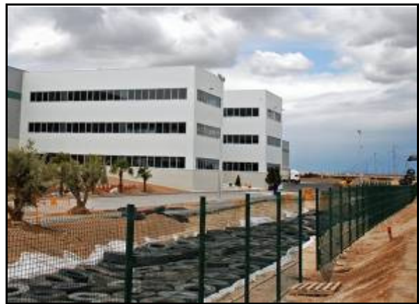
Figura 9. Depósito de Laminación-Infiltración de pluviales relleno con neumáticos usados. Zaragoza.

En síntesis, se implanta una alternativa innovadora y medioambientalmente viable a la gestión tradicional del agua de lluvia, convirtiendo lo que inicialmente era un problema en una oportunidad de realizar una Gestión Eficiente del Agua, y convirtiendo un desecho a tratar, en un recurso natural que proporciona ahorros en el consumo de agua potable y energía.