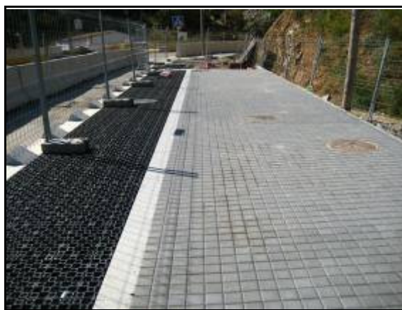
Figura 11. Franja de captación y transporte de las escorrentías en la Urb. Torre Baró, Barcelona.

Con la introducción de la red de SUDS en el ámbito de proyecto se cumple el objetivo principal de aprovechamiento de las aguas pluviales para riego y/o limpieza viaria, reduciendo de este modo tanto el consumo de agua potable en la ciudad como el volumen de agua a transportar y depurar por el sistema unitario municipal.