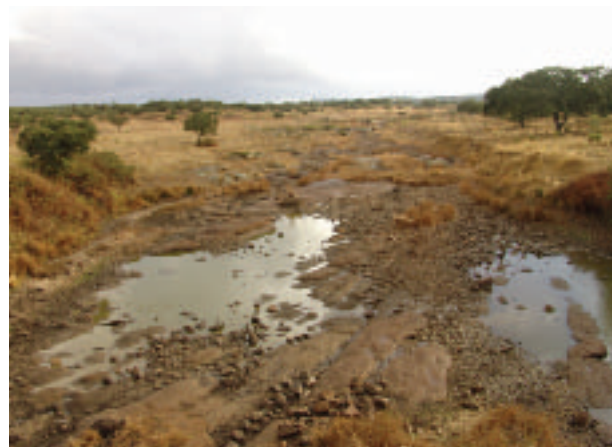
FOTOGRAFÍA 13. Ribera en estado pobre (Rib. Albarragena).