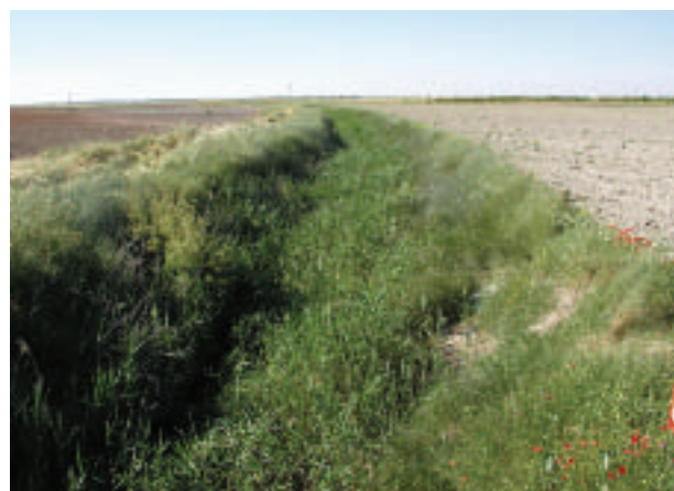
FOTOGRAFÍA 14. Ribera en estado muy pobre (Río Saona).