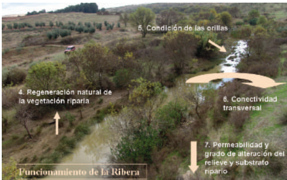
FIGURA 2. Atributos que caracterizan el funcionamiento hidrológico de las riberas en relación al equilibrio de la vegetación riparia con el actual régimen de caudales y usos del suelo, la estabilidad y heterogeneidad de las orillas y la conectividad lateral y vertical del cauce con sus riberas y llanuras de inundación.