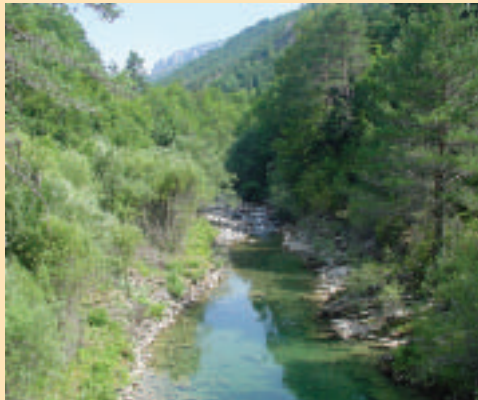
FOTOGRAFÍA 7. Orillas en condiciones naturales, con diversidad de condiciones hidráulicas y heterogeneidad del hábitat (Río Verall, Huesca).

Considerar nivel de "bankfull" el que alcanzan las avenidas ordinarias, a partir del cual generalmente se observa un cambio de pendiente en el talud de las orillas y se observa el desarrollo de una vegetación riparia leñosa, asentada sobre suelos no permanentemente saturados. Ponderar el nivel de erosión de origen antrópico en función de la frecuencia e intensidad de los síntomas de inestabilidad de las orillas (acumulación de sedimentos en la base de las orillas, presencia de grietas, desmoronamientos, descalzamiento de raíces, etc.), y del porcentaje de suelo desnudo en contacto con la lámina de agua, sin ningún tipo de cobertura vegetal. Considerar estado natural cuando estos síntomas correspondan a la dinámica natural del cauce.