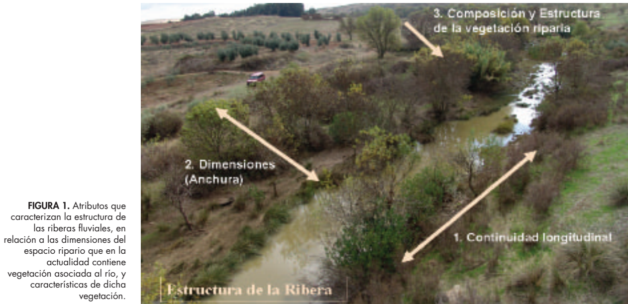
FIGURA 1. Atributos que caracterizan la estructura de las riberas fluviales, en relación a las dimensiones del espacio ripario que en la actualidad contiene vegetación asociada al río, y características de dicha vegetación.

dentro del mismo, o cuáles son las características de la cubierta vegetal existente en dicho espacio ripario. En este caso se analizan la composición y la estructura de la vegetación riparia existente , y se valoran en relación a las condiciones de referencia o de la vegetación potencial que corresponde al tramo, según las características hidrológicas, geomorfológicas y región biogeográfica en que se ubica.