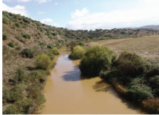
FOTOGRAFÍA 12. Ribera en estado regular (Río Matachel).