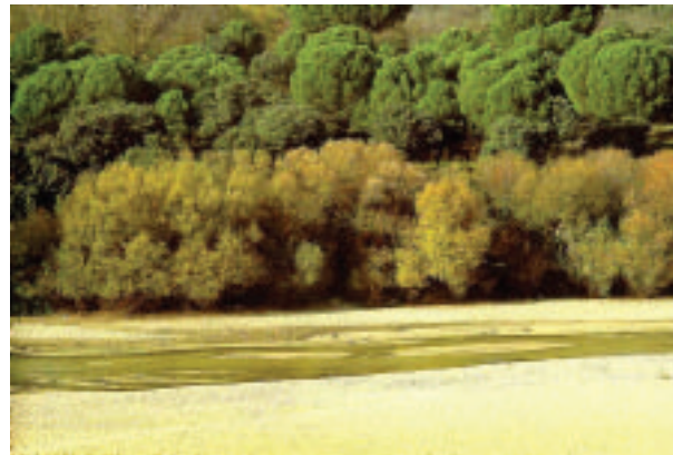
FOTOGRAFÍA 2. Río Alberche en Madrid. Tipología de río de llanura de la región Luso-Extremadurensis, silíceo, de tamaño grande, régimen pluvial, substrato de arenas, y riberas orladas de saucedas arbóreas mixtas.