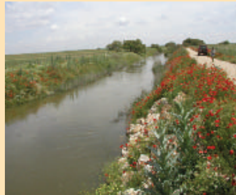
FOTOGRAFÍA 8. Orillas rectificadas, con gran homogeneidad de las condiciones hidráulicas y pérdida de diversidad de hábitats (Río Cigueta, Ciudad Real).